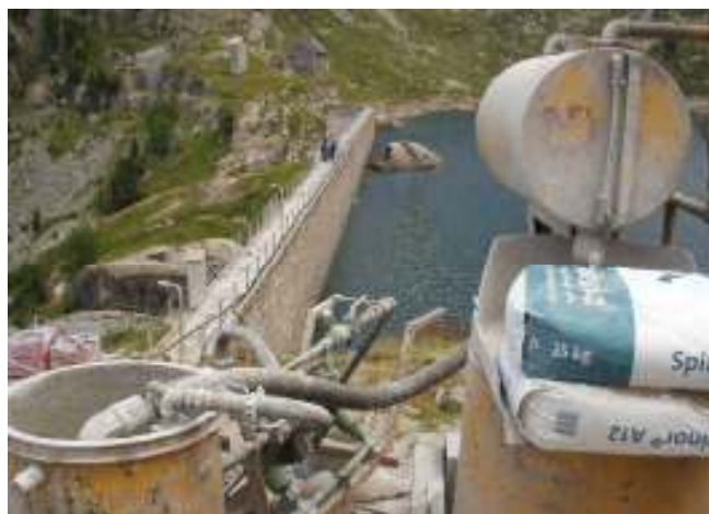
Vista del paramento aguas arriba de la presa.

Localización : Arties, Valle de Aran, Lleida. Propiedad : ENDESA GENERACIÓN Empresa especialista: KELLERTERRA Tipo de obra : Presa de hormigón Tipo de trabajos : Pantalla inyecciones en cuerpo de presa para conseguir estanqueidad. Tipo de microcemento: SPINOR A12 Consumo de SPINOR A12 : 9 Toneladas