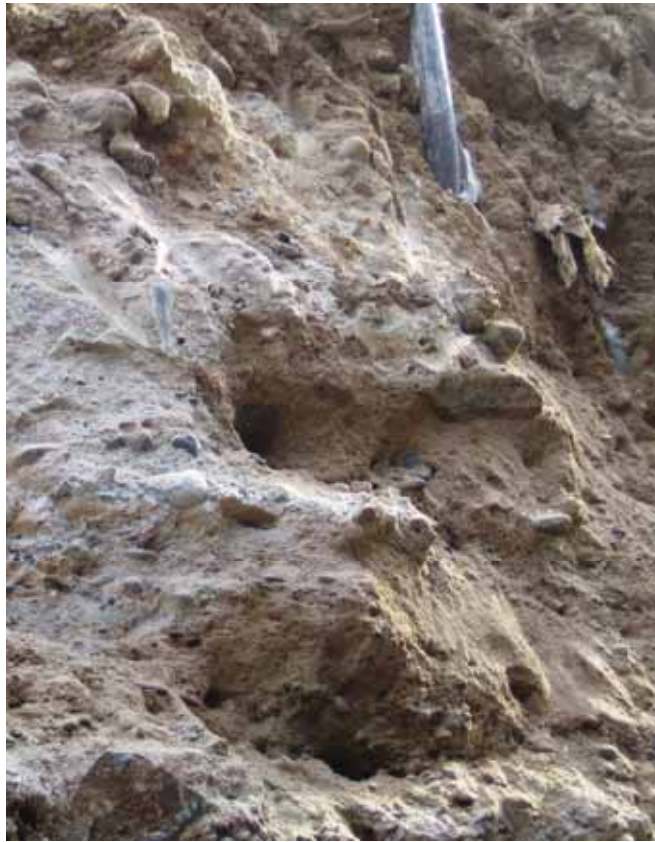
[Figura 4] Detalle del terreno excavado.

ejecutada sin agua para reducir al máximo la alteración de las propiedades del mismo. El diámetro de perforación fue de 113 mm [Figura 5].