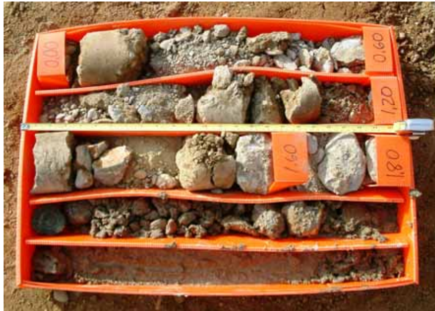
[Figura 8] Material recuperado hasta los tres metros de profundidad, en el sondeo perforado en la zona tratada.

Los resultados de este sondeo fueron muy dispares. El sondeo se perforó con diámetro de 113 mm e inicialmente en seco, para no alterar la muestra. Después de algo menos de dos metros de perforación aproximadamente y una vez llegados al material aluvial tratado, como resultado se obtuvo únicamente la recuperación de unos pocos centímetros de muestra [Figuras 8 y 9] y el desgaste de la corona de perforación (de widia), por no emplearse líquido de refrigeración durante el avance y por la dureza y características del material que se intentaba perforar. Seguidamente se realizó un ensayo SPT (a 2,00 m de profundidad) en el que se obtuvo rechazo.