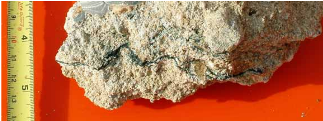
[Figura 10] Detalle de la forma de inclusión del microcemento en el aluvial.

El material no se podía recuperar porque su disposición durante la inyección (como pudo observarse en los taludes excavados) es a formar finas lajas intercaladas entre el material aluvial uniéndolo [Figura 10]. Durante la perforación el agua va lavando el material aluvial no cementado dejando libres las lajas de microcemento. Indicar que las paredes del sondeo se mantuvieron estables en toda su profundidad sin entubación, aún con el uso de agua de perforación.