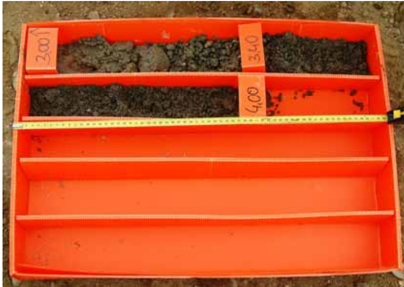
[Figura 5] Material perforado en el sondeo de caracterización del terreno original.

El material recuperado en la muestra inalterada y el SPT fueron ensayados en un laboratorio debidamente acreditado en los diferentes ámbitos. La curva granulométrica del depósito aluvial es la adjunta [Figura 6], en la que destacan los valores del 62 % del material que pasa por el tamiz 5UNE (arenas), el 20 % por el tamiz 0,4UNE (arenas finas) y el 6,8% por el tamiz 0,08UNE (limos y arcillas). Con las características del material puede considerarse, según ROM 0.5, un índice de poros de 0,30, un ángulo de rozamiento interno de 35° y un módulo de deformación drenado de 20 MPa.