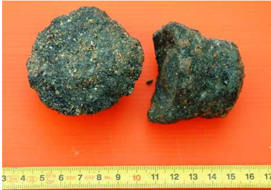
[Figura 9] Detalle del tipo de muestra de material inyectado que se consiguió recuperar.

el sondeo era lavado, recuperándose por la boca del sondeo el agua de refrigeración con una carga de sedimento y teñida de color verdoso (indicador de la disolución del microcemento SPINOR A12, el cual una vez fraguado presenta este color). El material recuperado era escaso y con fracciones lavadas.