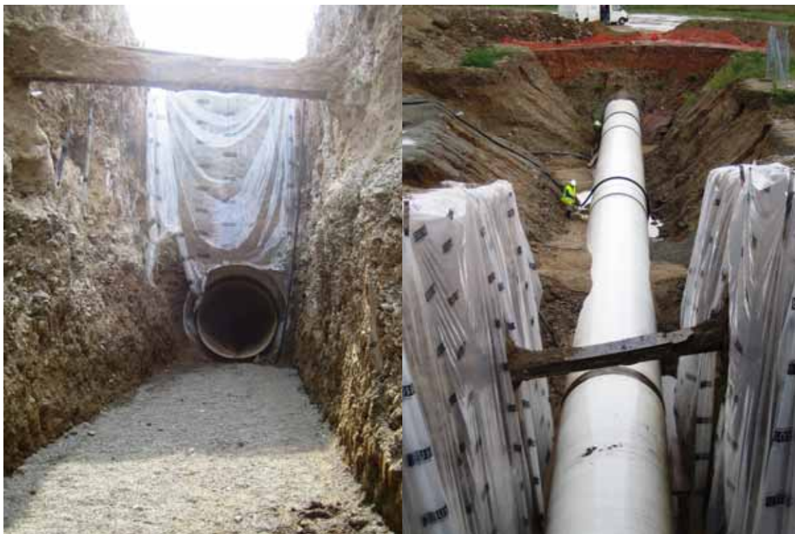
[Figura 1] Vista de la excavación y de la tubería una vez colocada.

En este artículo se describen los trabajos de investigación realizados para caracterizar geomecánicamente un terreno de origen aluvial tratado con inyecciones de lechadas a base de cemento y microcemento SPINOR A12. El tratamiento del aluvial, realizado en la zona del Vallés Oriental (provincia de Barcelona), tenía por objetivo poder realizar una excavación con total seguridad en las inmediaciones de una carretera, para el paso de una tubería de dos metros de diámetro, perteneciente a la sociedad ATLL (Aigües Ter Llobregat), bajo la misma sin cortar el tráfico [Figura 1].