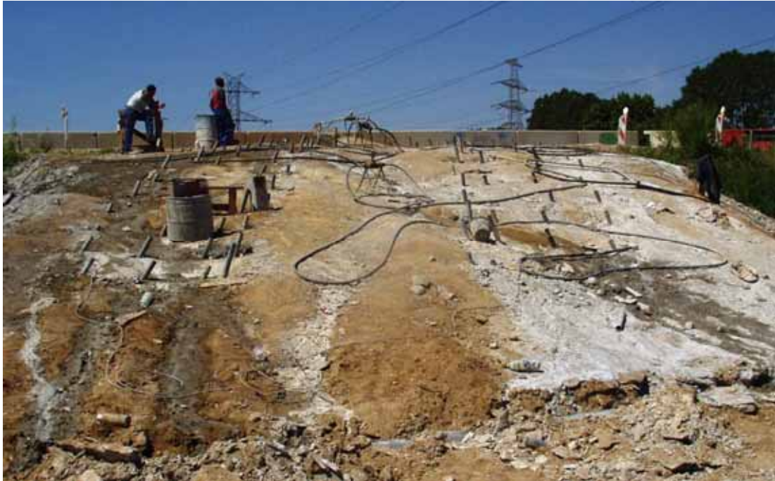
[Figura 2] Distribución de los tubos manguitos en la superficie a excavar contigua a la carretera.

El tratamiento se realizó sin presencia de nivel freático.