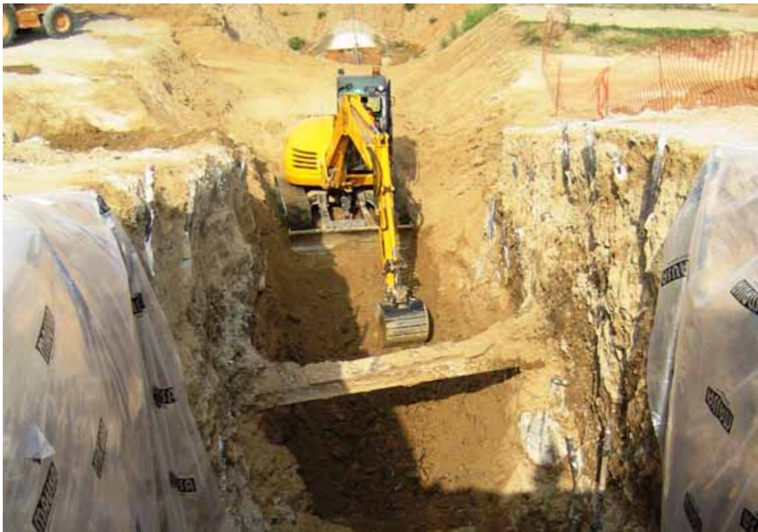
[Figura 3] Vista de los trabajos de excavación para colocación de la tubería.