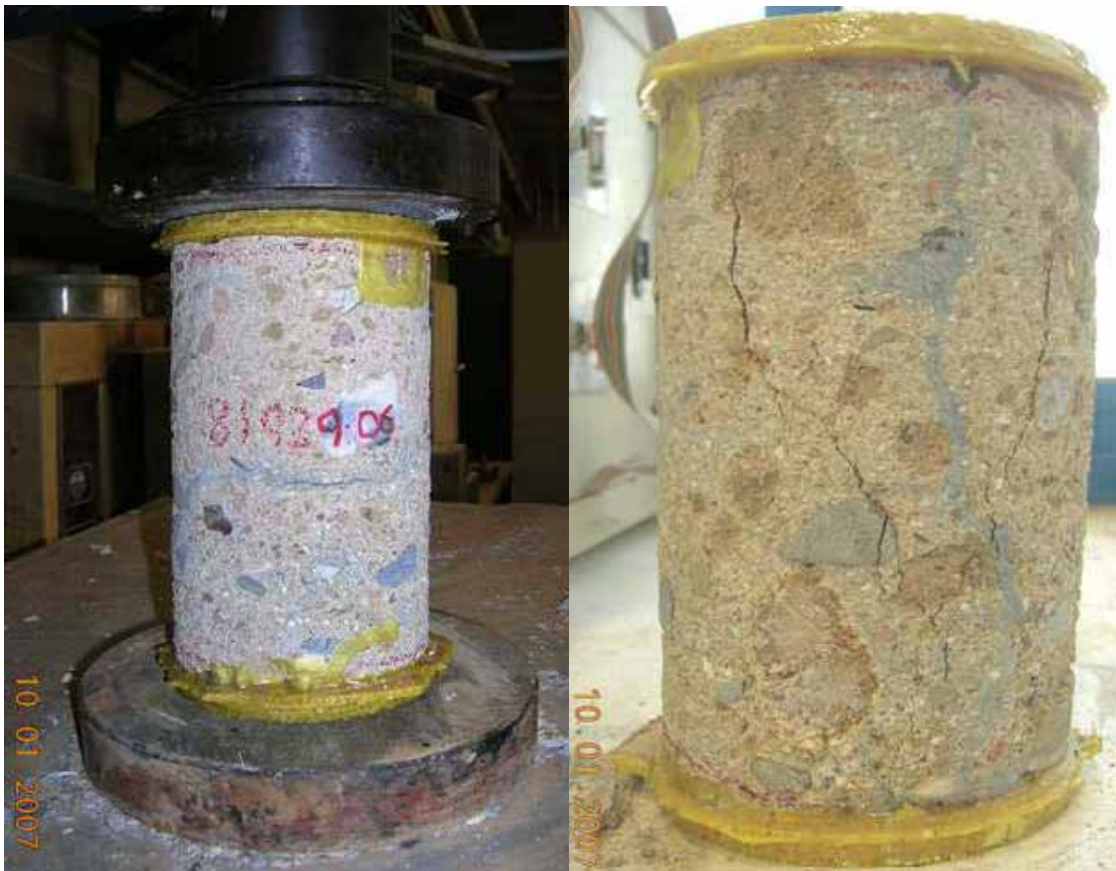
[Figura 12] Probeta obtenida a partir de la muestra en bloque, antes y después de ensayada.

A partir de la muestra en bloque, y con un trabajo cuidadoso, en el laboratorio, se consiguió obtener una única probeta para ensayar de dimensiones: 9,86 cm de diámetro y 17,20 cm de altura.