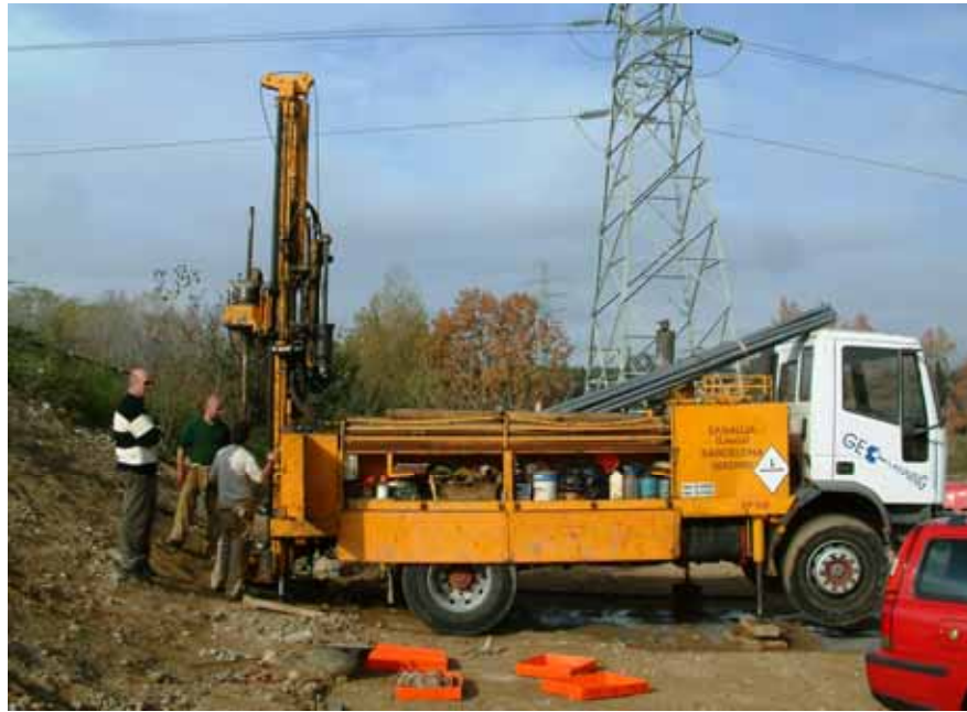
[Figura 7] Ejecución de sondeo en la zona inyectada.

Los resultados de este sondeo fueron muy dispares. El sondeo se perforó con diámetro de 113 mm e inicialmente en seco, para no alterar la muestra. Después de algo menos de dos metros de perforación aproximadamente y una vez llegados al material aluvial tratado, como resultado se obtuvo únicamente la recuperación de unos pocos centímetros de muestra [Figuras 8 y 9] y el desgaste de la corona de perforación (de widia), por no emplearse líquido de refrigeración durante el avance y por la dureza y características del material que se intentaba perforar. Seguidamente se realizó un ensayo SPT (a 2,00 m de profundidad) en el que se obtuvo rechazo.