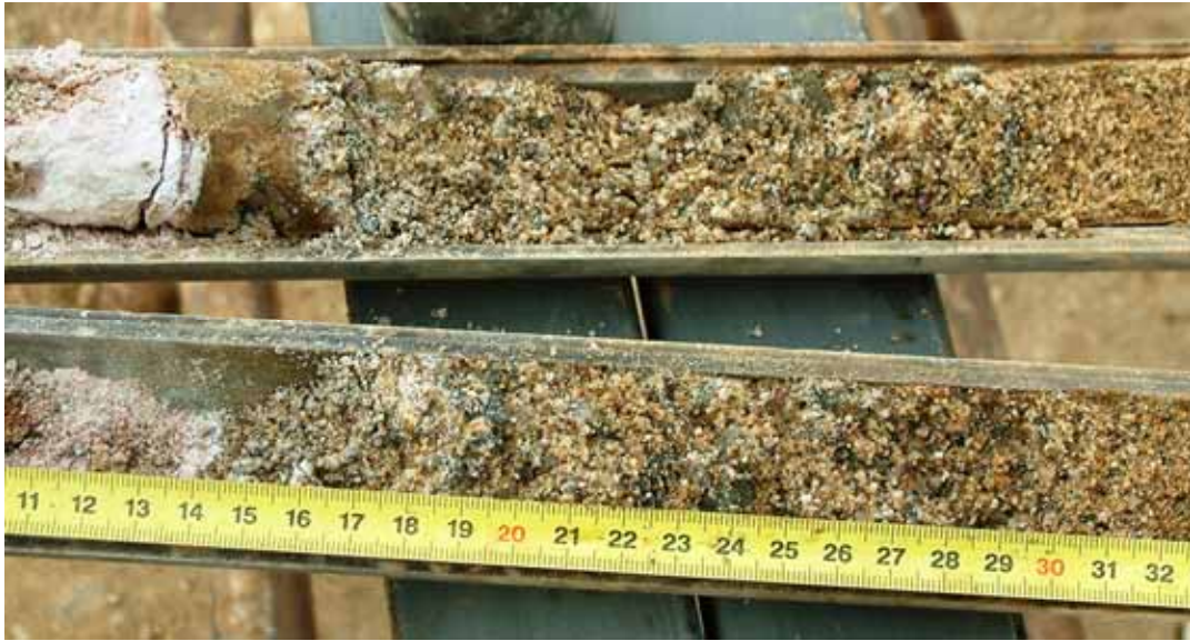
[Figura 11] Detalle de la forma de inclusión del microcimento en el aluvial.

Ante la imposibilidad de conseguir en el sondeo una muestra inalterada de terreno tratado para ser ensayada en laboratorio, se optó por coger una muestra en bloque de dimensiones adecuadas para tratar de tallarla en el laboratorio.